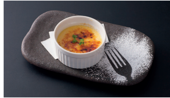
自家製クレームブリュレ