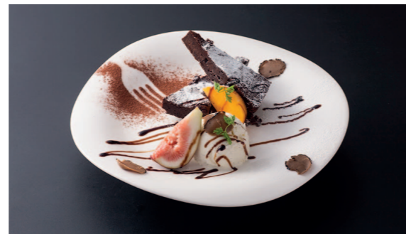
トリュフとガトーショコラと阿蘇の濃厚バニラアイス