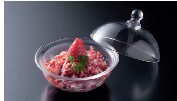
当店自慢の季節のフローズフルーツ削り

★ トリュフとガトーショコラと 990円 阿蘇の濃厚バニラアイス ヨーロッパ直輸入・最高ブランドのトリュフ使用