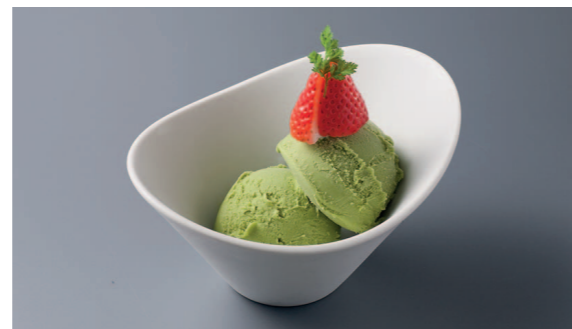
ジェラート 宇治抹茶